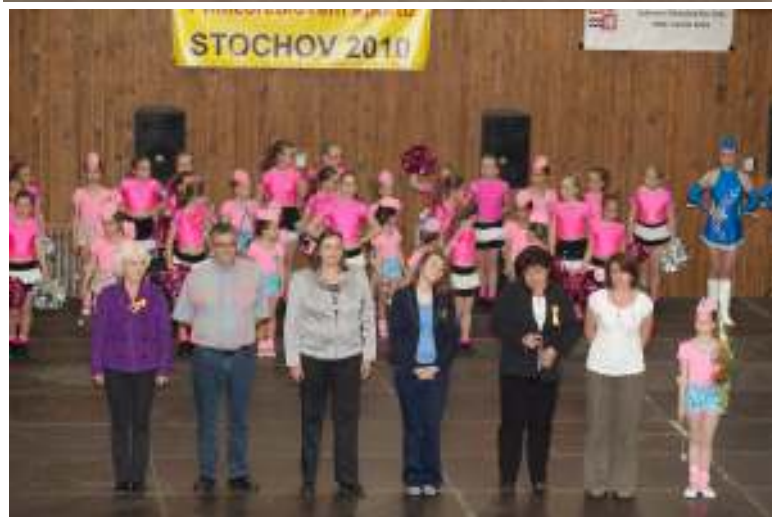
Ukázky fotek z minulého ročníku mistrovství ČR