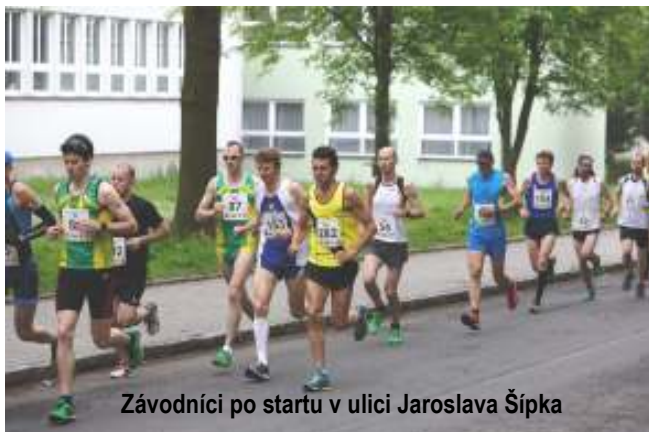
Závodníci po startu v ulici Jaroslava Šípka