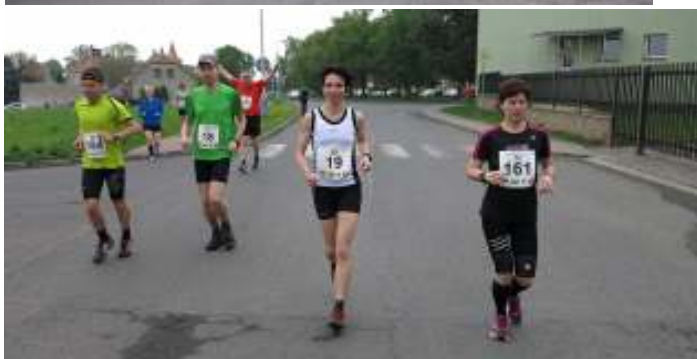
Proběhnutí před závodem