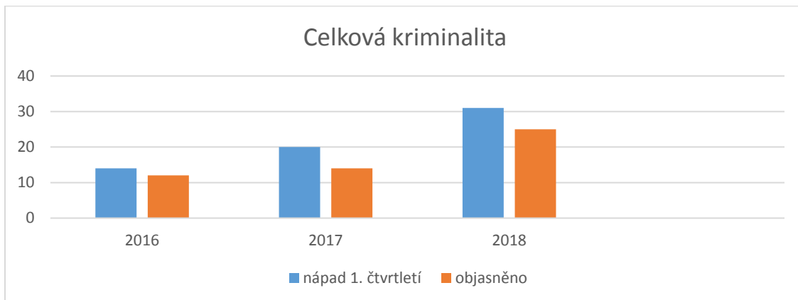
Tab. č. 2 – skladba nápadu trestné činnosti za 1. čtvrtletí 2016, 2017, 2018