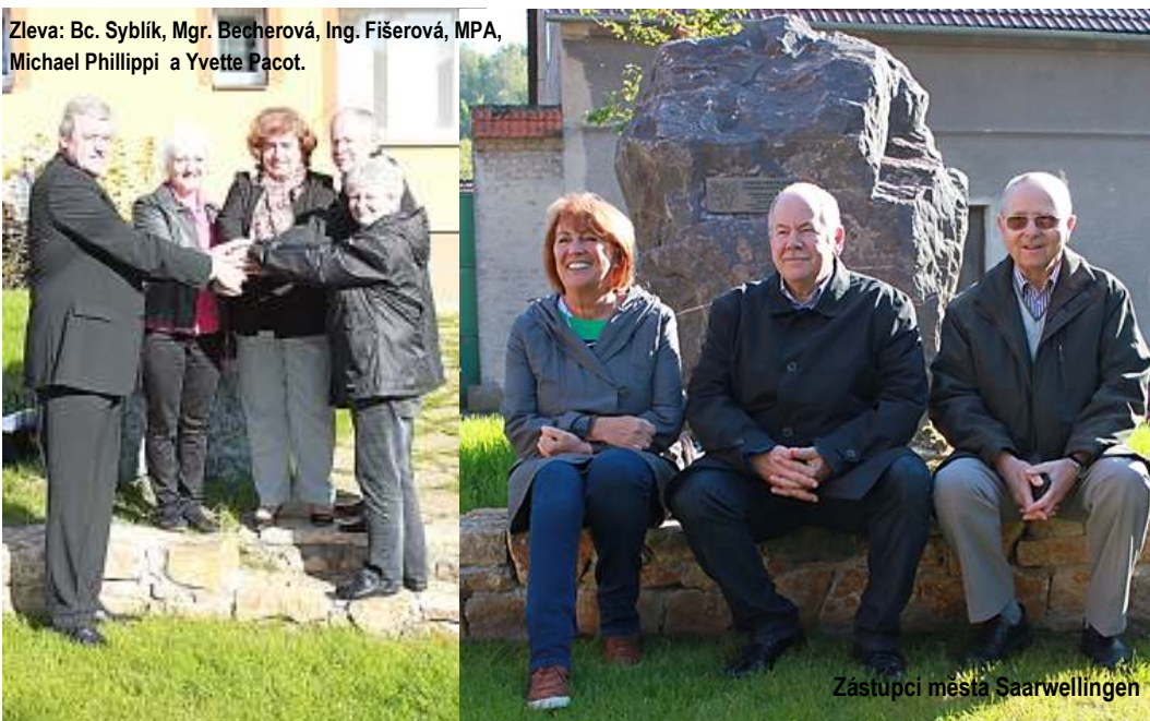
Zástupci města Saarwellingen