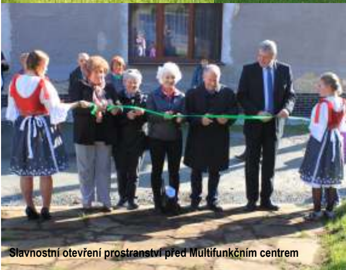
Slavnostní otevření prostranství před Multifunkčním centrem