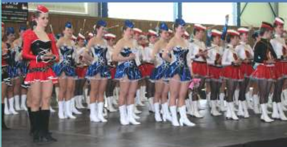
Pařádá: Mažoretky Květinčky TJ Sokol Kladno pod záštitou IFMS a města Stochov