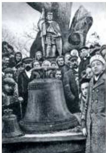
Poslední okamžik, kdy loučí se občané stochovští s rekvírovanými zvony Václavem a umíráčkem r. 1917